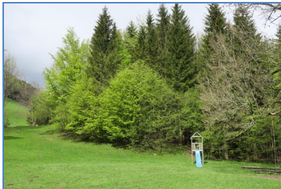
Wiese hinter dem Haus