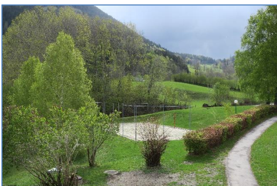
Beachvolleyballplatz direkt beim Haus