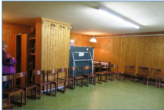
Disco im Keller