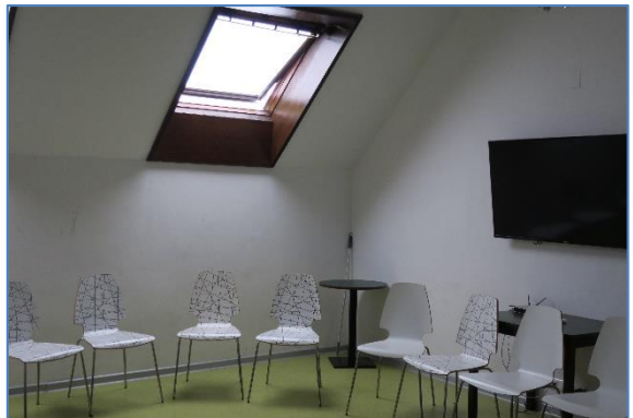
Seminarraum im DG = 3. Stock