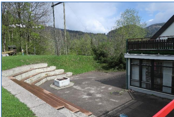
Lagerfeuerplatz direkt beim Haus auf der Terrasse