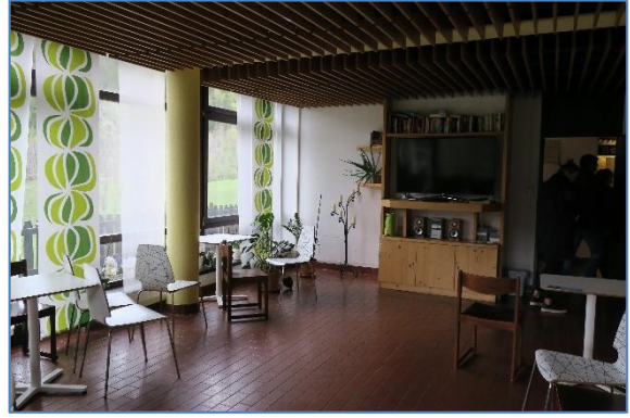
Seminarraum 2 im EG