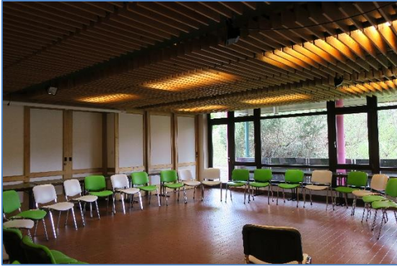
Seminarraum 1 im EG